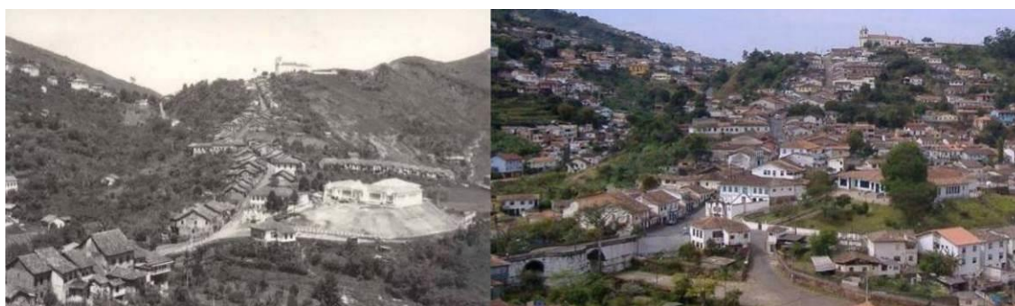
Fig. 1- Panorâmica do crescimento urbano desordenado no bairro Antônio Dias: década de 1950 e ano de 2006.

Na Figura 1, demonstra-se comparativamente um bairro central da cidade na década de 1950 e no ano de 2006 que é o marco temporal do efetivo envolvimento municipal na regulação urbana da cidade. Observa-se, portanto, o crescimento urbano ocorrido de forma desordenada.