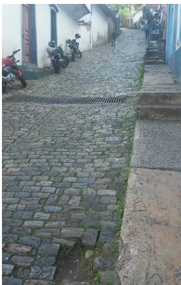
Fig. 3 - Rua Teixeira Amaral, bairro centro, Ouro Preto, MG.

Na imagem mostrada na Figura 3, observa-se uma rua central, com dimensão insuficiente e inclinação acentuada; observa-se, também, a inexistência de passeio em um lado da via, além da existência de uma escada construída sobre o logradouro público. O passeio existente é estreito e escorregadio devido ao revestimento e à inclinação. Além disso, as escadas existentes no passeio apresentam piso e espelho com dimensões desconfortáveis e, em alguns locais, ficam obstruídas por mesas e cadeiras de estabelecimentos comerciais.